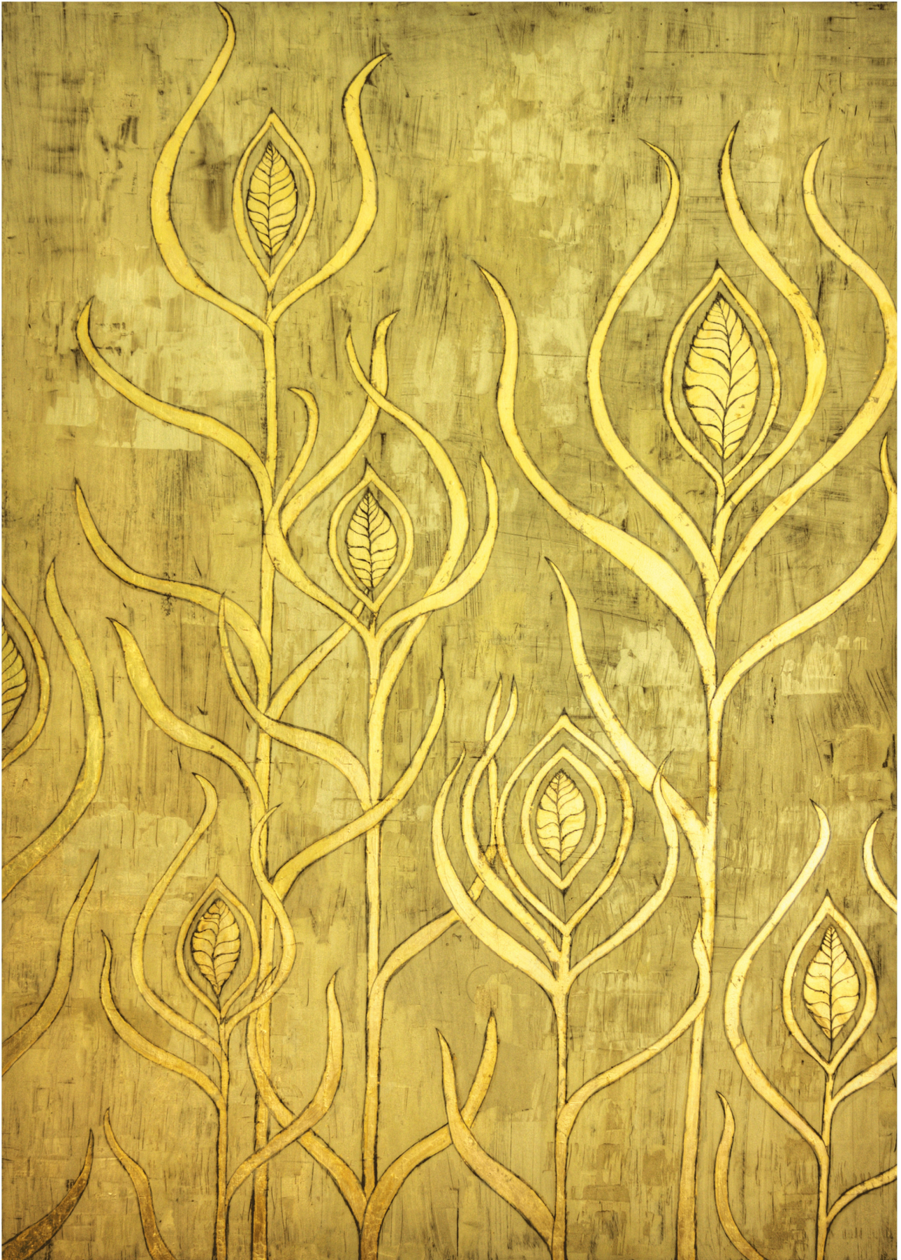
Sonnenkinder I Blattgold, Ölfarbe auf Holz 100 x 140 cm