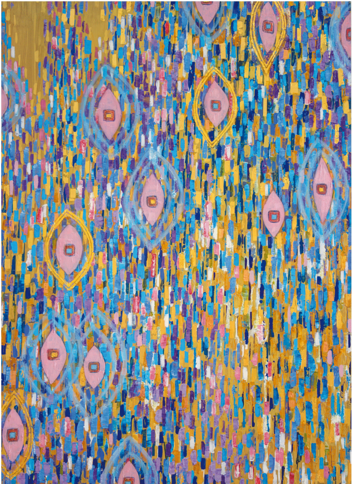
Reise über das Wasser Ölfarbe, Blattgold auf Holz 70 x 96 cm