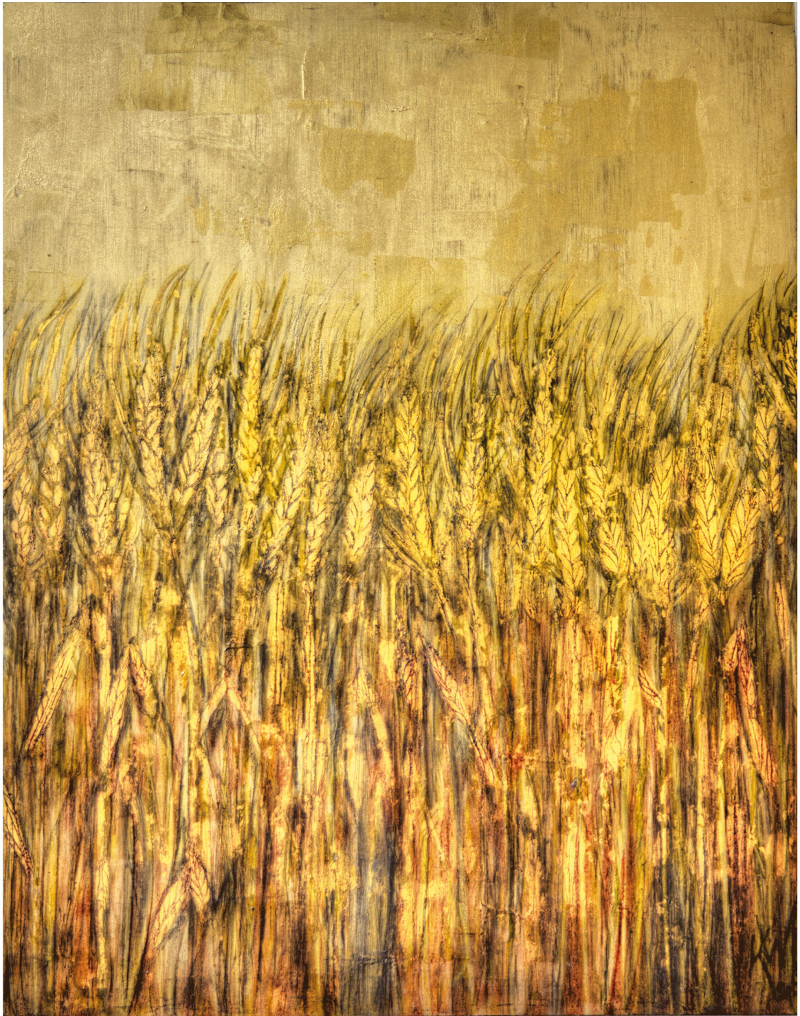
Gerste II Blattgold und Ölfarbe auf Holz 36 x 45 cm