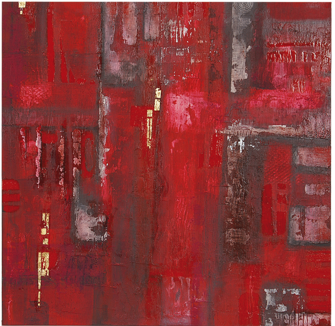
Triptychon Crimson Bridges 'Looking for Lazarus' Ölfarbe, Blattgold auf Holz Gesamtinstallatin ca 148 x 65 cm