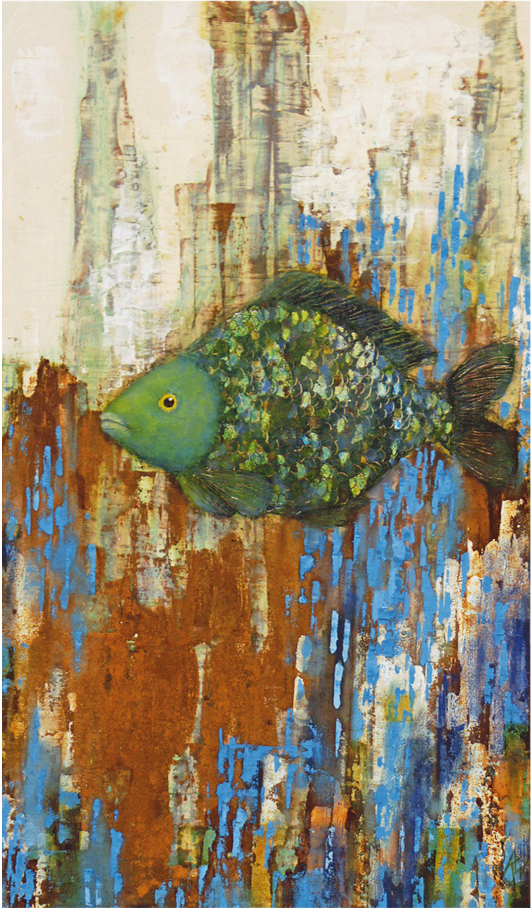
Diptychon 'Fisch Gespräch' Ölfarbe, Mischtechnik und Blattsilber auf Holz je 41 x 69 cm