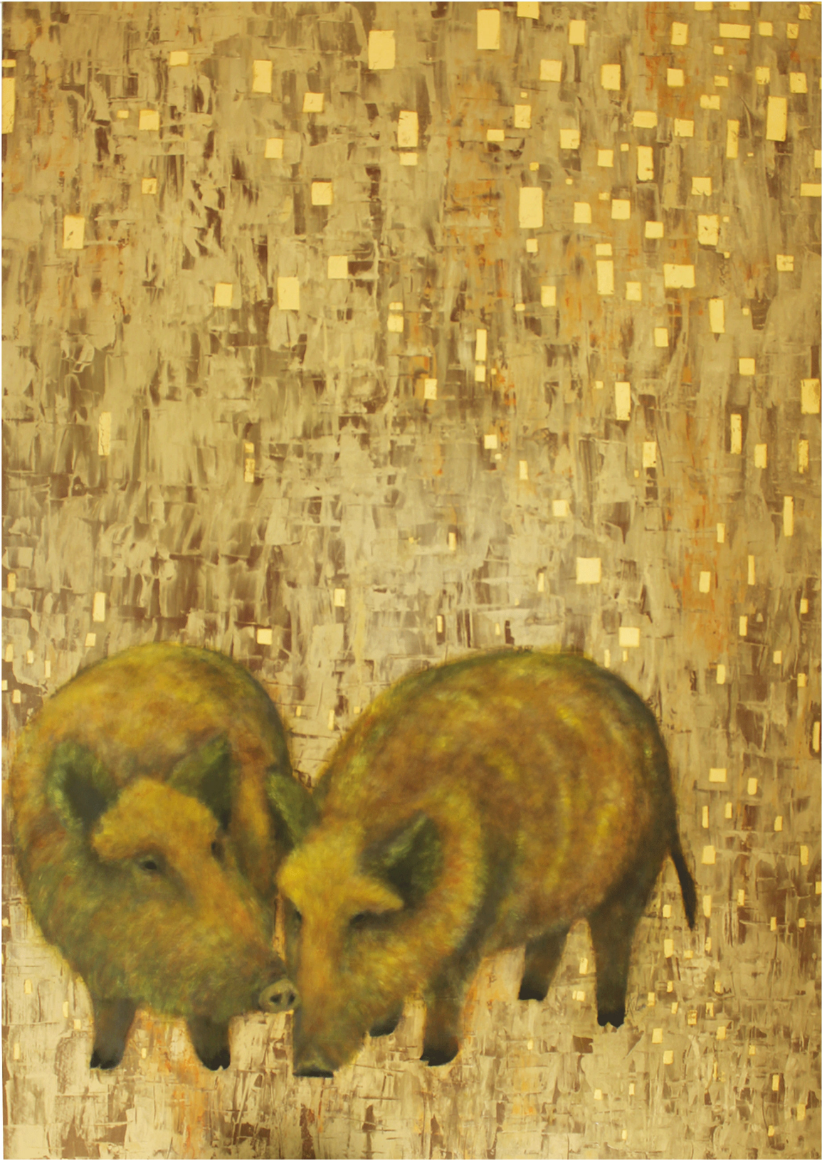
Composition Sauvage Ölfarbe, Blattgold auf Holz 148 x 100 cm