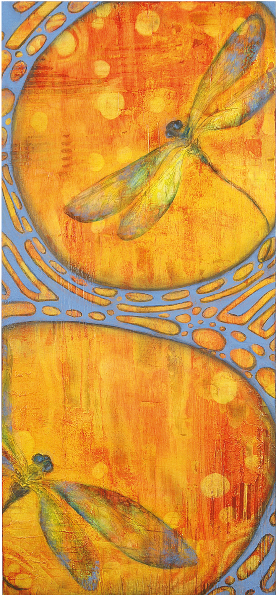
Diptychon mit Libellen Ölfarbe auf Holz Je 79 x 37 cm