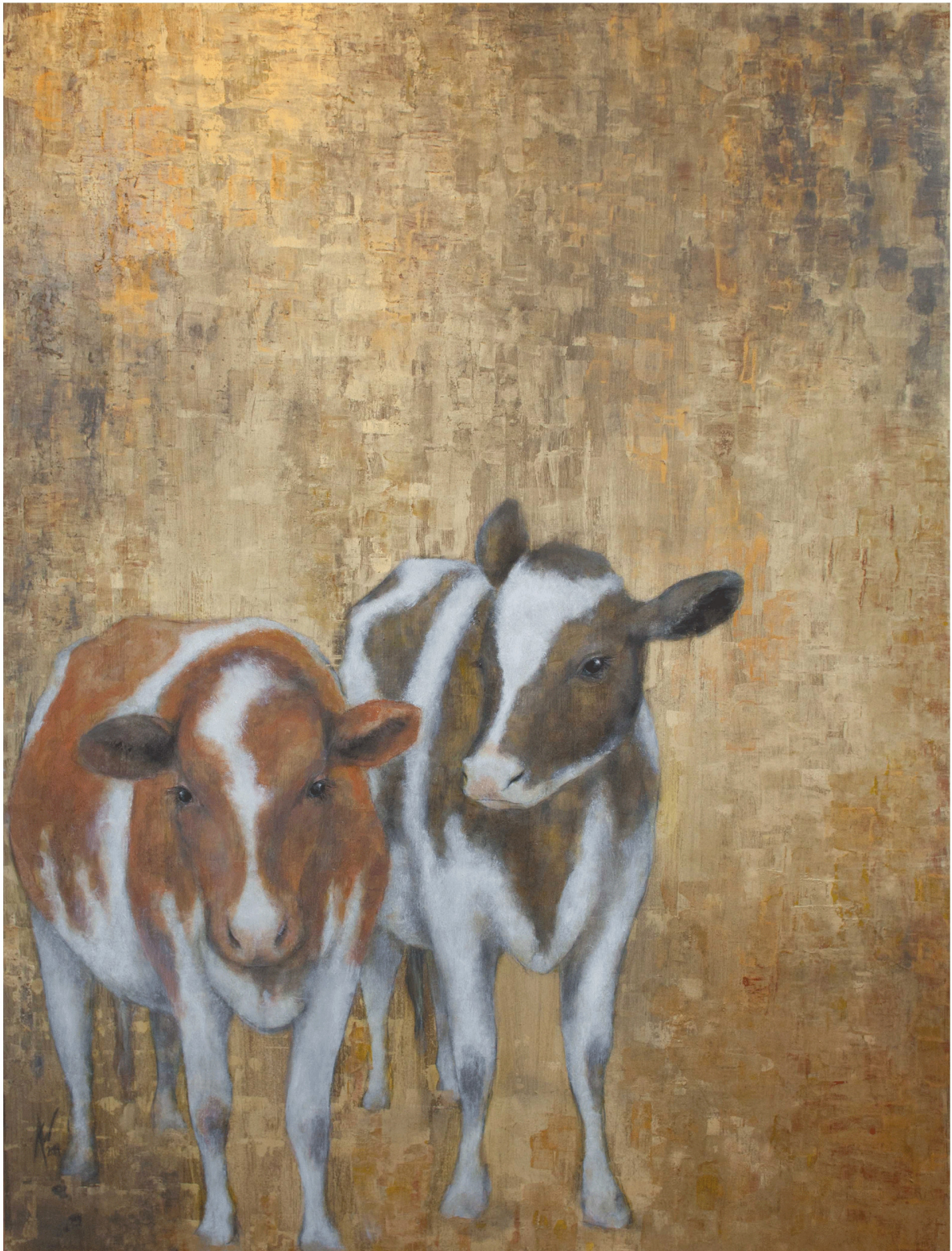
GOLD KÜHE I Ölfarbe, Blattgold auf Holz 100 x 75 cm