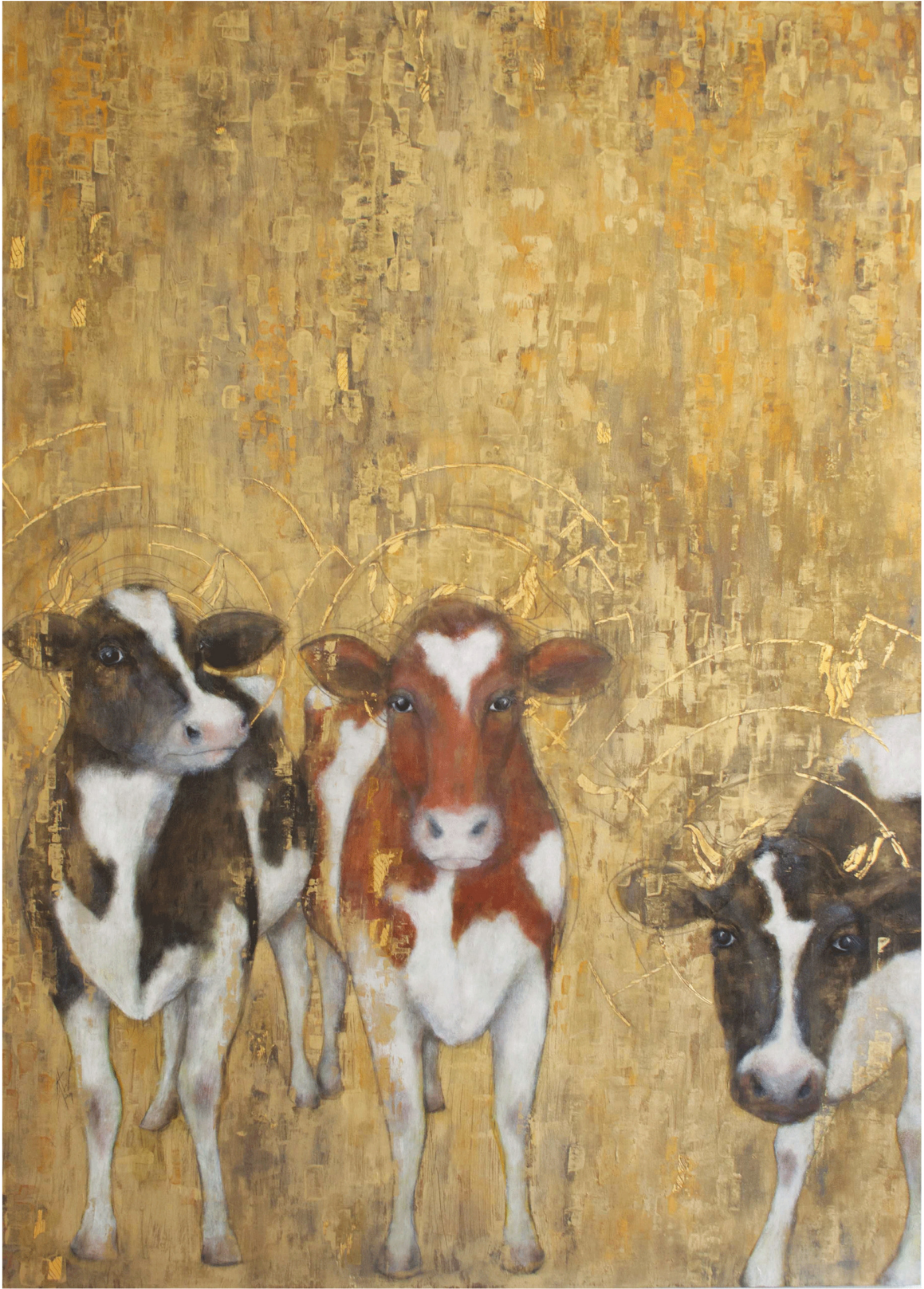
GOLD KÜHE II Ölfarbe, Blattgold auf Holz 180 x 139 cm