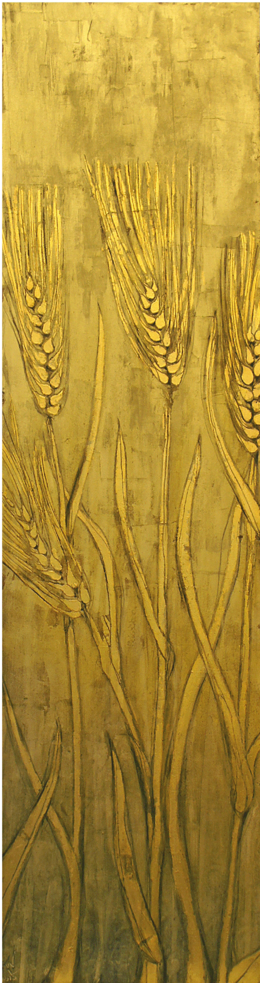
Korn I und Korn II Blattgold und Ölfarbe auf Holz je 28 x 102 cm