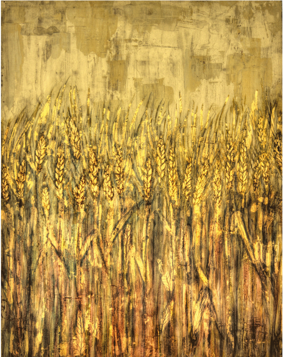
Gerste I Blattgold und Ölfarbe auf Holz 36 x 45 cm