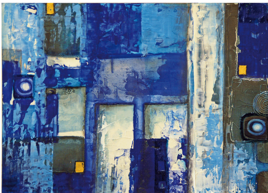
Triptychon Tranquillité Bleu Ölfarbe, Blattgold auf Holz Gesamtinstallation ca. 110 x 51 cm