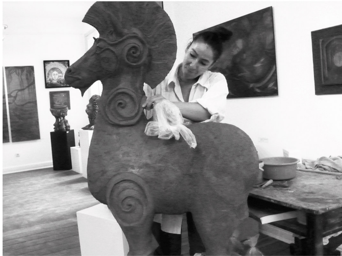
Bei der Entstehung einer keramischen Großplastik in der Werkstatt Schlossinsel, 25355 Barmstedt 2012