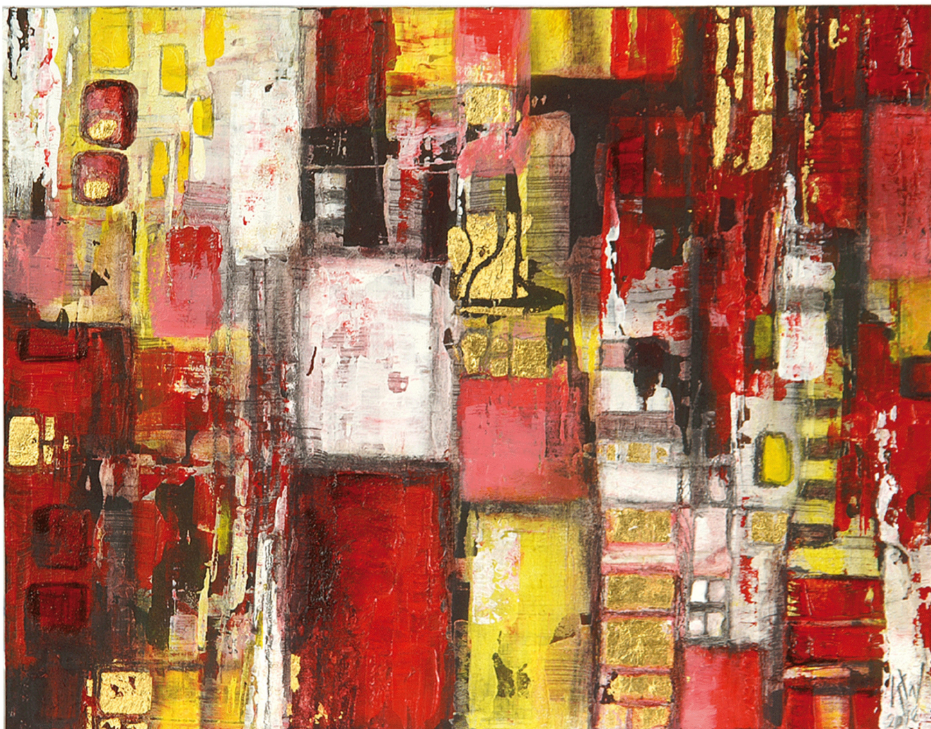
Encontrar o caminho (port.: 'Den Weg finden') Ölfarbe, Blattgold je 21x28 cm