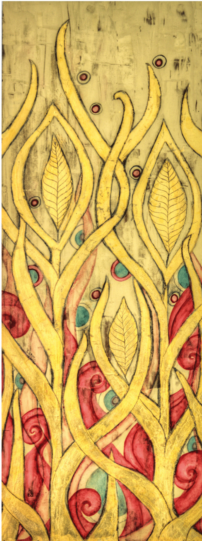
Sonnenkinder II Blattgold, Ölfarbe auf Holz 81 x 31 cm